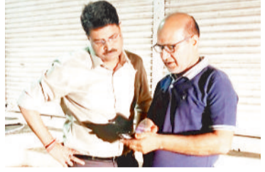
व्यापारी से पूछाकर करते एसएसपी।

रखकर बाहर निकले। वे पैसे वाला थैला अपनी बलेनो कार में रखकर दरवाजा बिना लॉक किए दुकान का शटर बंद कराने में व्यस्त हो गए। उसके बाद कार लेकर अपने घर चले गए। घर जाकर कार के अंदर डिकची खोलकर देखे तो थैला गायब था। उन्होंने अपने हमाल से फोन कर पूछा तो उसने बताया कार का दरवाजा बंद नहीं था। वे आनन फानन में व्यापार विहार अपने दुकान गए और अन्य व्यापारियों को सूचना दी,