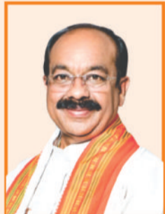
श्री अरुण साहू जी उपमुख्यमंत्री छत्तीसगढ़