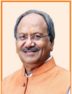
श्री बृजमोहन अग्रवाल जी सांसद, रायपुर