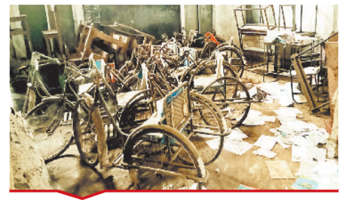
देवकीनंदन स्कूल में विकलांगों के लिए रखा गया वाहन हो रहा खराब।

[ बिल्हा | मस्तूरी | तखतपुर | मुंगेली | कोटा | लोरनी | सरगांव | पेंड़ा | बेलतरा | रतनपुर | पथरिया ]