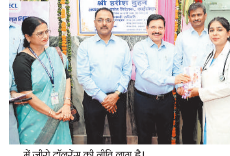
में जीरो टॉलरेंस की नीति लागू है।

उत्तर: वित्त वर्ष 2025-26 में एसईसीएल 160 मिलियन टन से अधिक कोयला उत्पादन कर चुका है, जो पिछले वर्ष की तुलना में लगभग 6.6% अधिक है। कंपनी ने 164 मिलियन टन से अधिक कोयला डिस्पैच किया है और 336.5 मिलियन क्यूबिक मीटर ओबीआर हासिल किया। देश के कुल कोयला उत्पादन में एसईसीएल की हिस्सेदारी लगभग 17-18% है। कोरबा क्षेत्र की वेदरा, कुसमुंडा और दीपका जैसी मेगा खदानें इस उपलब्धि की प्रमुख आधारशिला हैं और देश की ऊर्जा सुरक्षा में निरंतर महत्वपूर्ण भूमिका निभा रही हैं।