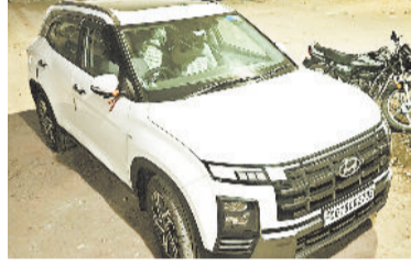
वह कार जिससे हुई उठाईगीरी।

हरिभूमि न्यूज ►► बिलासपुर व्यापार विहार छोटी पार्किंग के पास एक व्यापारी बिक्री रकम 8 लाख 15 हजार रुपए, 1 लाख 40 हजार के 60 नग चांदी के सिक्के सहित थैला कार में रखकर शटर बंद करा रहे थे। इसी दौरान एक युवक उनकी कार का दरवाजा खोलकर पैसा व सिक्के से भरा थैला चोरी कर भाग निकला। उठाईगीरी की वारदात से व्यापारियों में हड़कंप मच गया। चोरी करने वाले युवक की तस्वीर सीसीटीवी कैमरे में कैद हो गई है। शहर में नाकाबंदी कर उठाईगीरी की तलाश की जा रही है।